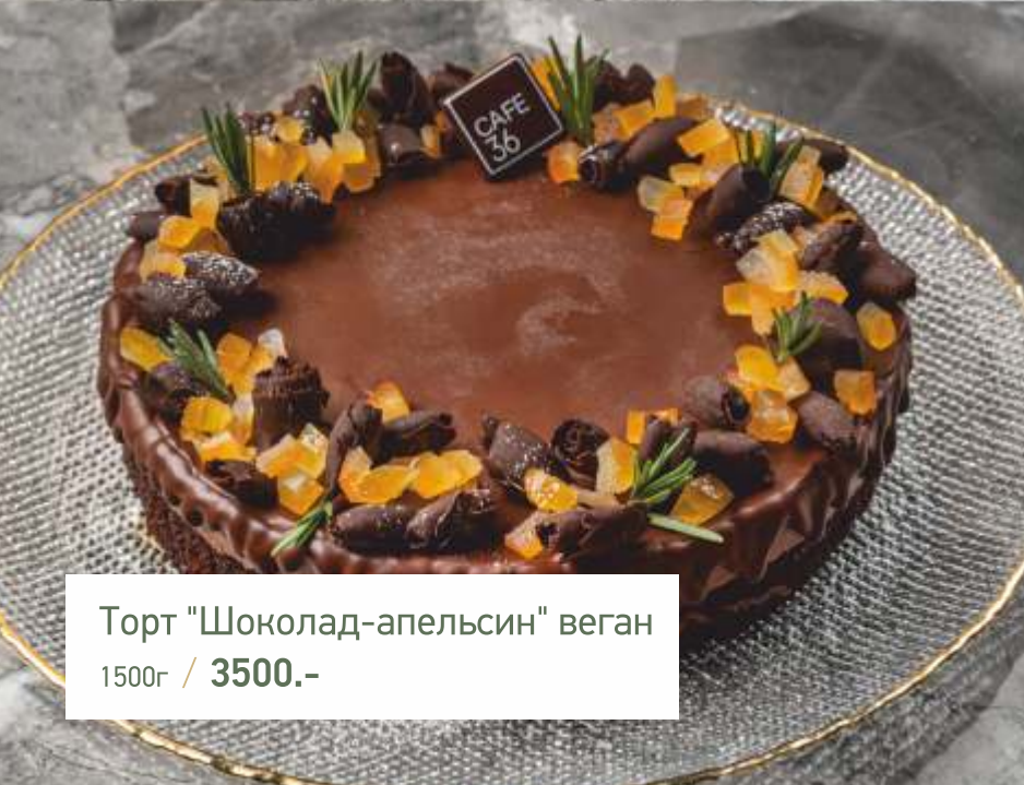
Торт "Шоколад-апельсин" веган