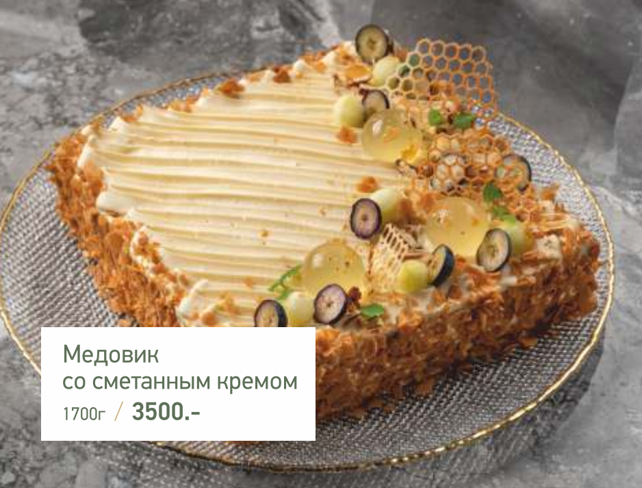
Медовик со сметанным кремом 1700г / 3500.-