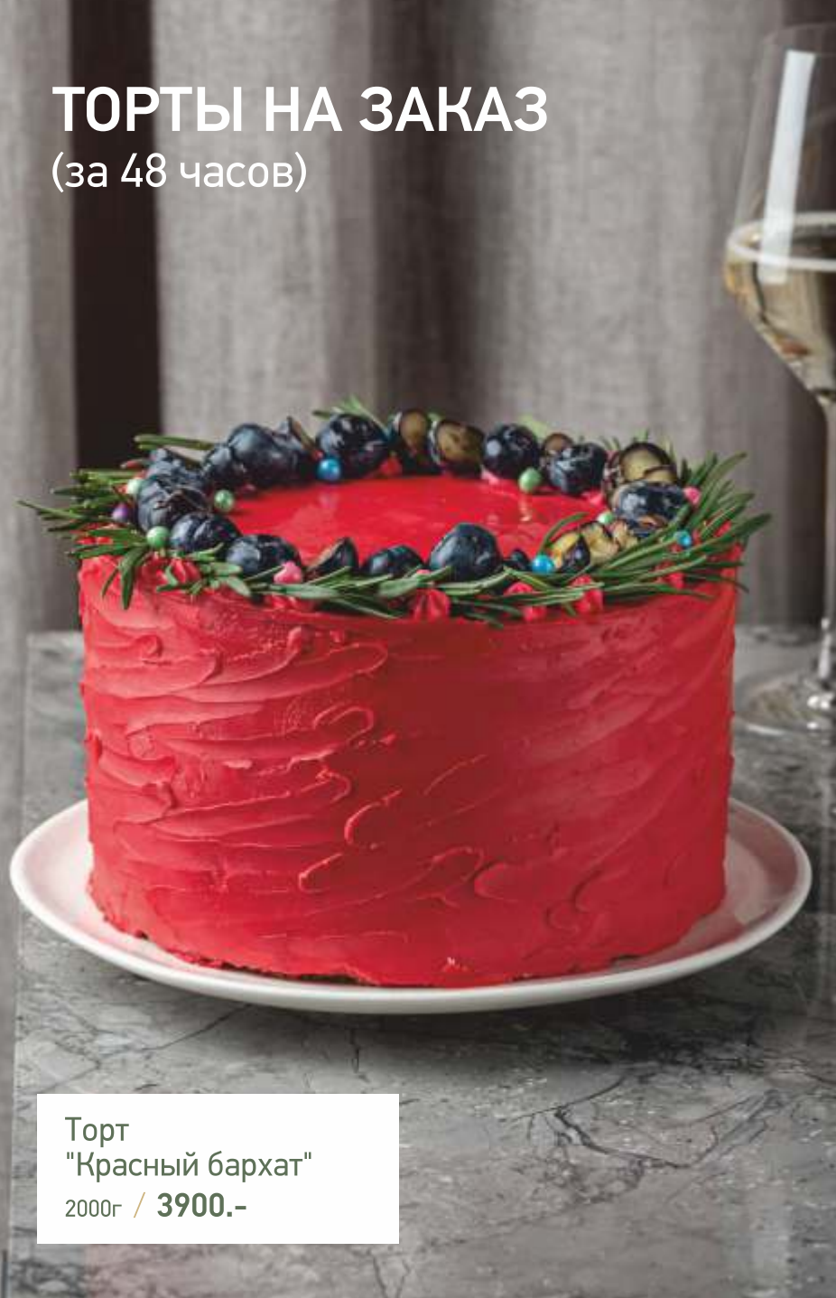
Торт "Красный бархат" 2000г / 3900.-