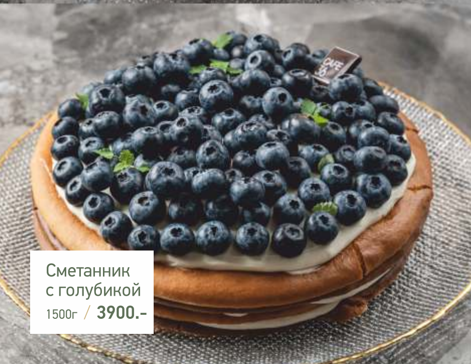
Сметанник с голубикой 1500г / 3900.-